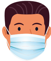
สวมหน้ากากอนามัยปกปิด จมูก, ปาก, และคาง