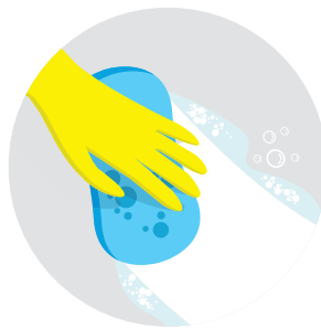
หมั่นทำความสะอาดฆ่าเชื้อพื้นผิวที่ถูกสัมผัสบ่อยๆ (เช่น เครื่องมืออุปกรณ์จุดชำระเงิน, ห้องน้ำ, สวิตช์ปุ่มเปิดปิดไฟ, โทรศัพท์, และ กลอนประตู)