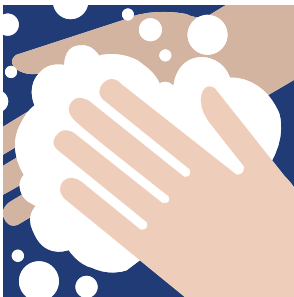
หมั่นทำความสะอาดมือด้วยน้ำอุ่นและสบู่ และควรล้างในระยะเวลาไม่ต่ำกว่า 20 วินาที ทุกครั้งไป หรือ ใช้เจลล้างมือ