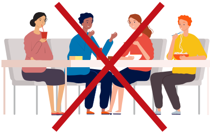
ห้ามรวมตัวกับผู้อื่น (ไม่ว่าในเวลาพักหรือหลังเลิกงาน)