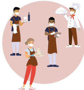
ทำงานกับกลุ่มเล็กๆเดิมๆ หลีกเลี่ยงการเปลี่ยนกลุ่มเพื่อนร่วมงาน