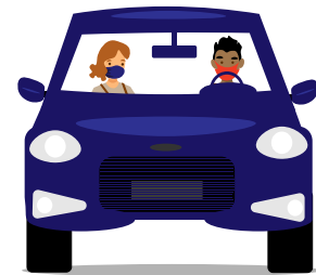
หากท่านต้องอาศัยเพื่อนร่วมเดินทางในการไปทำงาน, กรุณาเดินทางกับเพื่อนร่วมเดินทางกลุ่มเดิม, สวมหน้ากากอนามัย, เปิดกระจกรถทุกบานระหว่างเดินทาง