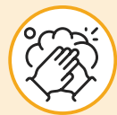
ኣእዳውካ ብዙሕ ግዜ ኣጽሪ