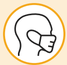
ናይ ገጽ ማስክ ንግበር