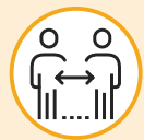
ናይ 2 ሜትር (6 ጫማ) ርሕቀትካ ሓሉ